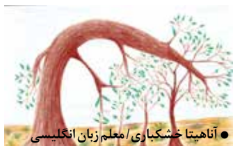
● آناهیتا خشکیاری / معلم زبان انگلیسی