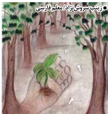
● زینب سروش نژاد / معلم فارسی