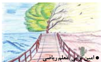
● امین ترابی / معلم ریاضی